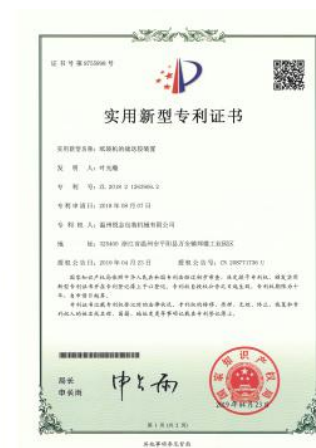
ZL 2018 2 1263906.2