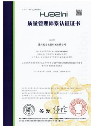
质量管理体系认证