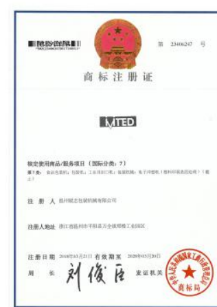
质量管理体系认证