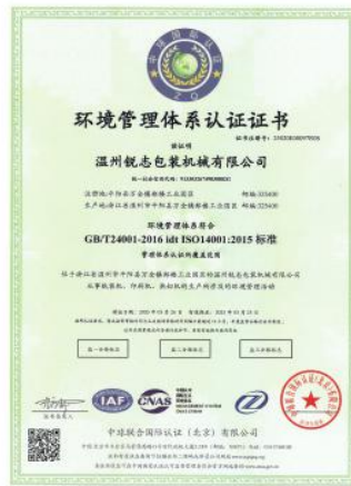
环境管理体系认证