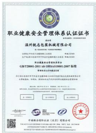
职业健康安全管理体系