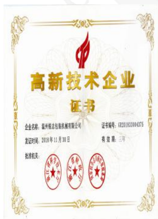
高新技术企业证书