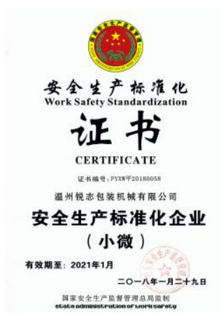
环境管理体系认证