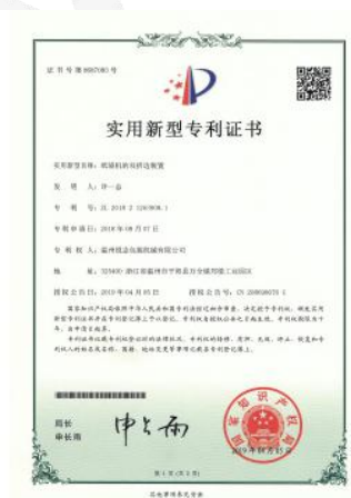
ZL 2018 2 1263908.1